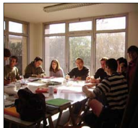
Formation Stratégie d'entreprise auprès des producteurs du Vaucluse.

sera peut-être nécessaire ensuite en fonction de la nature de votre projet.